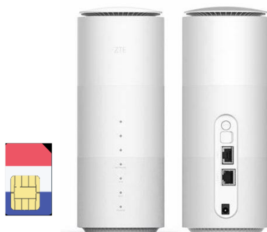
ZTE MC801A 5180 LTE Cube Box (5G) + + Carte Sim eSIMsmart Consignes d'utilisation