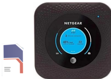
NETGEAR MR1100 (4G) + carte sim Bouygues Consignes d'utilisation