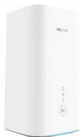
Huawei H122-373 Cube Box (5G) Consignes d'utilisation