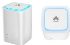
Huawei 5180 LTE Cube Box (4G) Consignes d'utilisation

Pour tout autre renseignement sur nos Cube Box, vous trouverez plus d'informations sur notre site internet en scannant le QR code ci-dessous :